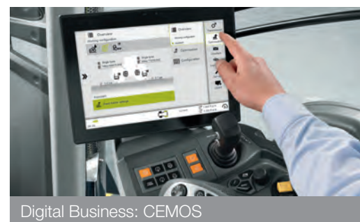
Digital Business: CEMOS